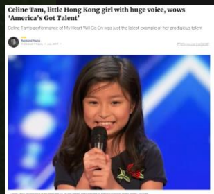
HK got Talent